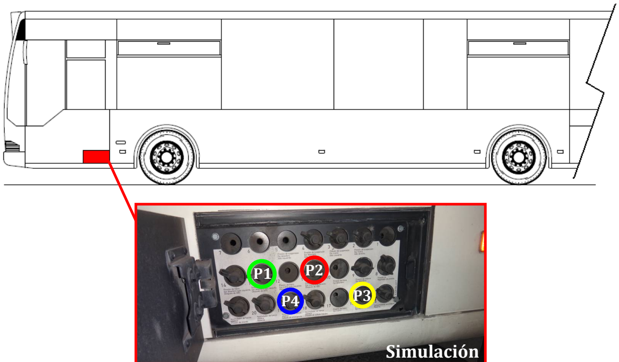
Imagen 2: Toma sensores de presión